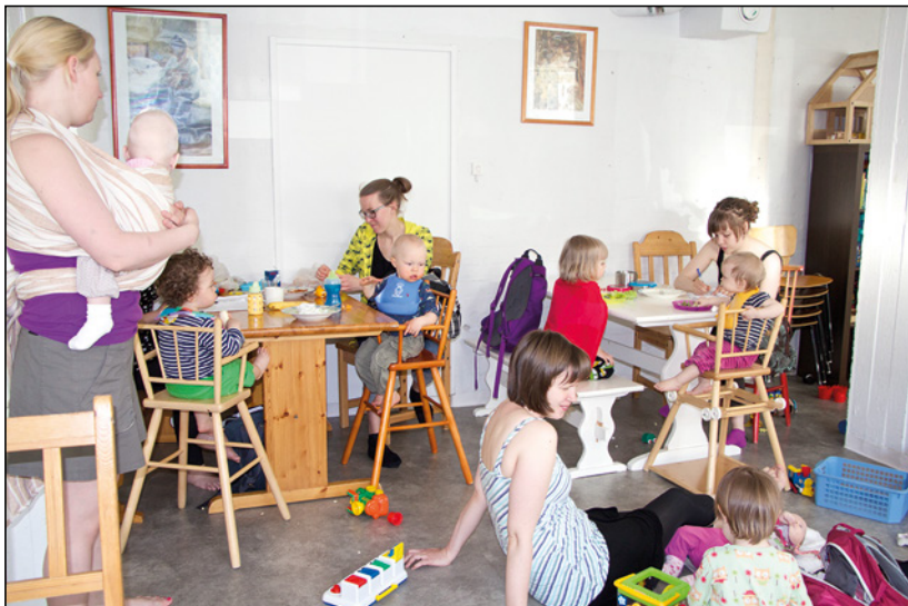
Lasten kanssa puuhaillen.

Hallituksen kokoukset ovat aina olleet avoimia kaikille kiinnostuneille, ja ryhmänvetäjäksi ryhtyminen on helppoa. Napapiirin nettisivuilla tiedotetaan toiminnasta avoimesti ja kattavasti. Avoin, lämminhenkinen ja idearikas yhdistys ottaa mielellään vastaan kaikki ajatukset ja uudet toimijat.