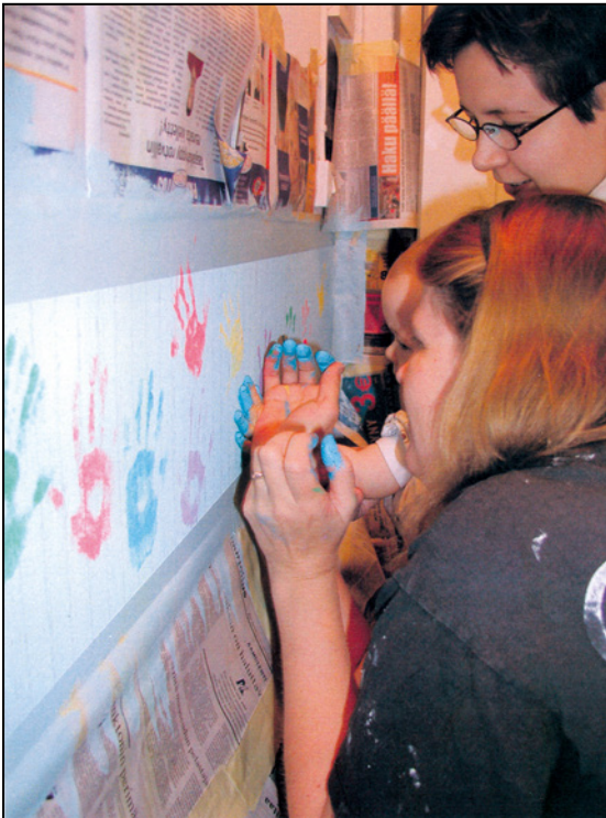
Uuden Napapiirin eteiseen jätettiin kädenjäljet.