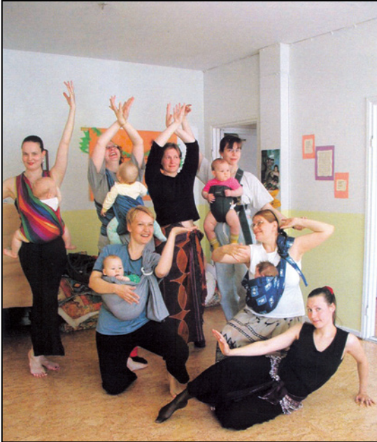
Kantoliinatanssin ryhmä 2000-luvun alussa.